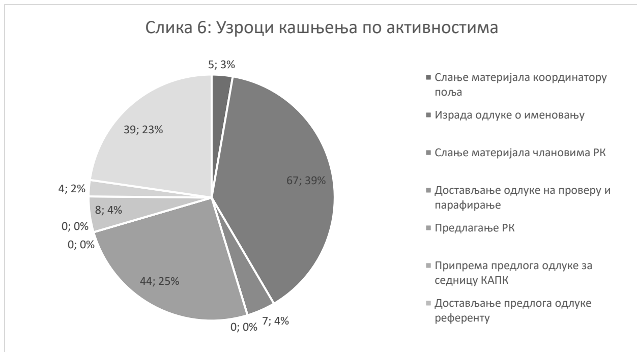
Слика 6: Узроци кашњења по активностима

Просечан број дана кашњења за 14 студијских програма обухваћених у узорку износи 174 дана. Од тога служба НАТ-а је каснила 79 дана, рецензентске комисије 51 дан, а Поткомисија КАПК 44 дана. Када се узму у обзир појединачне активности, највише се каснило код израде одлуке о именовању (67 дана), предлагања чланова рецензентске комисије (44 дана) и одговарања рецензентске комисије на захтеве Поткомисије КАПК (39 дана). Слика 6 приказује колико се у просеку каснило код сваке активности у поступку акредитације студијских програма.