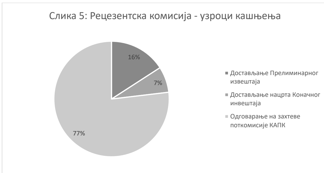
Слика 5: Рецезентска комисија - узроци кашњења

Приликом израде Прелиминарног, односно нацрта Коначног извештаја каснило се у просеку 8, односно 4 дана. Када је у питању одговарање на захтеве Поткомисије КАПК просек кашњења износи 39 дана. Међутим, детаљнијом анализом табеле може се уочити да се у случају ове активности кашњење јавило код само 3 студијска програма, а да се у случају једног студијског програма каснило чак 508 дана. Разлог толиког кашњења је то што је Поткомисија КАПК чак 8 пута враћала Коначни извештај на допунска објашњења. У случају друга два студијска програма код којих се каснило, Коначни извештај је ради кориговања враћан 2 пута.