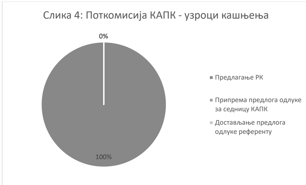
Слика 4: Поткомисија КАПК - узроци кашњења

Припремање предлога одлука за седницу КАПК, као и достављање предлога тих одлука референту након седнице је код свих 14 студијских програма урађено у року. Кашњење се једино јавило код предлагања чланова рецезентске комисије и оно је у просеку износило 44 дана. У случају једног студијског програма кашњење је износило чак 247 дана.