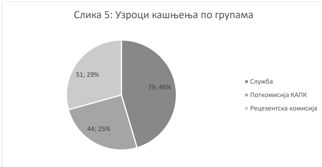
Слика 5: Узроци кашњења по групама

Просечан број дана кашњења за 14 студијских програма обухваћених у узорку износи 174 дана. Од тога служба НАТ-а је каснила 79 дана, рецензентске комисије 51 дан, а Поткомисија КАПК 44 дана. Када се узму у обзир појединачне активности, највише се каснило код израде одлуке о именовању (67 дана), предлагања чланова рецензентске комисије (44 дана) и одговарања рецензентске комисије на захтеве Поткомисије КАПК (39 дана). Слика 6 приказује колико се у просеку каснило код сваке активности у поступку акредитације студијских програма.